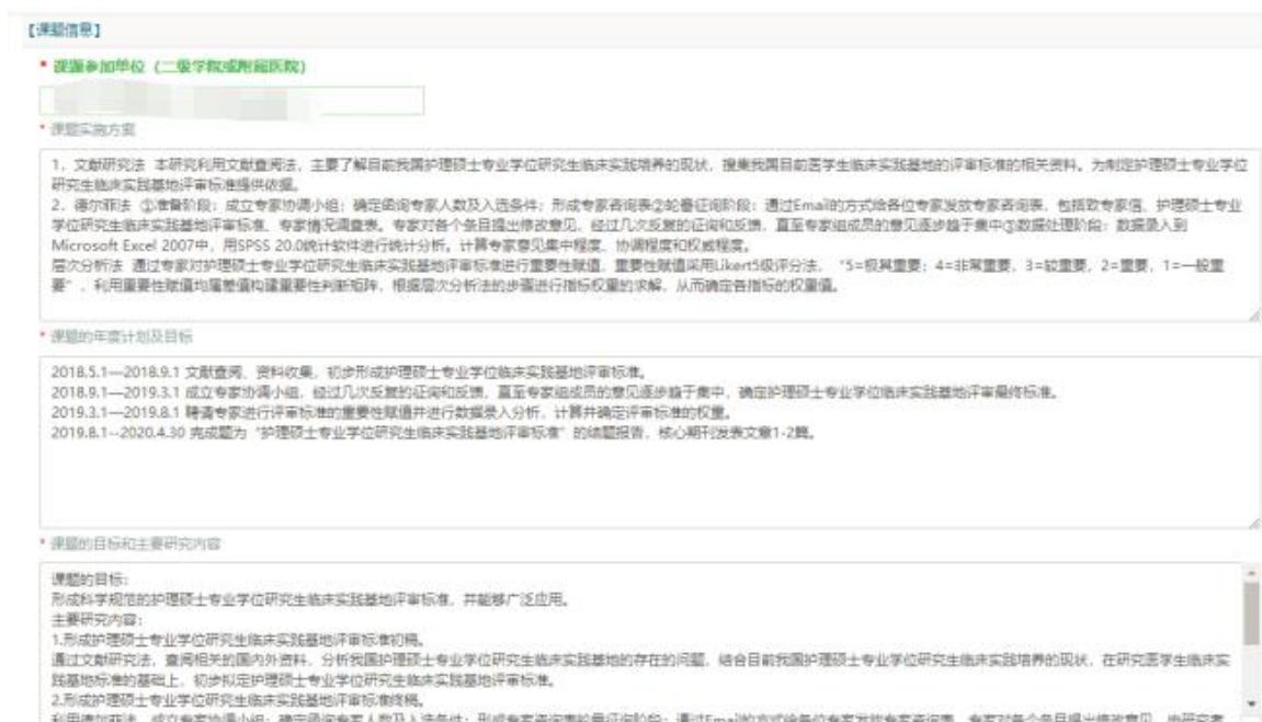
图 录入合同内容界面（课题信息）

录入信息如下，其中“课题参加单位”为课题负责人及课题组成员所在单位（二级部门、附属医院等），多个单位名称用顿号分隔。课题实施方案字数不超过 600 字，课题的目标和主要研究内容不超过 800 字，“课题实施方案”、“课题的年度计划及目标”和“课题的目标和主要研究内容”系统自动同步到最终生成的合同书 word 文件中，请确保此处填写内容正确，格式规范。