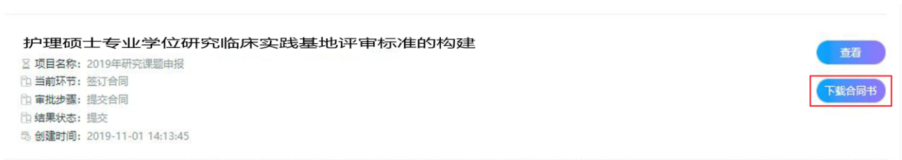
图 下载合同书界面

核实录入信息准确无误后，点击【提交】上传合同信息，提交成功自动进入【我的申报项目】界面。在【我的申报项目】界面，选择已提交合同的课题项目，点击【下载合同书】将 word 文件保存到本地。