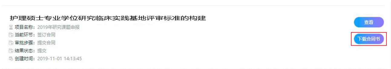
图 下载合同书界面

核实录入信息准确无误后，点击【提交】上传合同信息，提交成功自动进入【我的申报项目】界面。在【我的申报项目】界面，选择已提交合同的课题项目，点击【下载合同书】将 word 文件保存到本地。